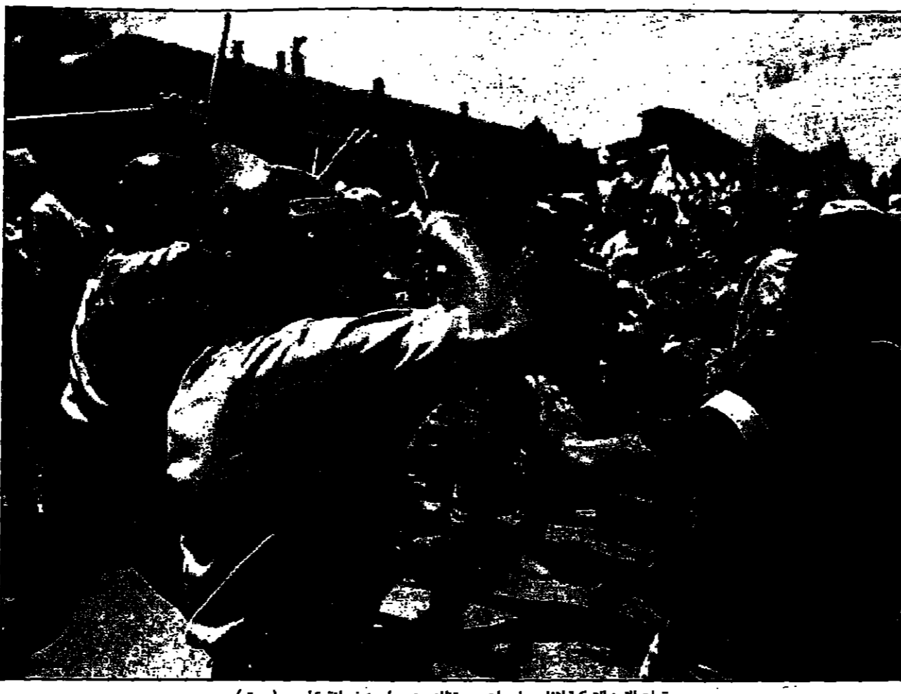
قوات الامن التركية أثناء مواجهات مع متظاهرين سريانيين في ليرة (سوري)

طهران - قن - تشهد العلاقات الإيرانية السعودية هذه الأيام تطوراً ملحوظاً عكسه الاتصالات الجارية في مستويات عليا بين طهران والرياض لتجاوز صعوبات سببية والوصول إلى توقيع هيئتي العلاقات بين البلدين بحدود الأمن القومي وعلاقات إيران العربية والإسلامية، مما يبرز ذلك من المفاوضات الرسمية في طهران. وكان عبد العزيز الخويطر وزير الدولة السعودي قد قام لاسم الأول بزيارة قصيرة لطيحان نقل خلالها رسائل من الملك فهد بن عبد العزيز والأمير عبد الله بن عبد العزيز ولي العهد نائب رئيس مجلس الوزراء ورئيس الحرس الوطني إلى الرئيس الإيراني مهدي رفسنجاني، تكرر بينهما المشاورات الثنائية وسبل تطويرها. ويعتقد مراقبون في طهران أن الرئيس الإيراني الذي من المقرر أن يزور الرياض قبل الثالث من شهر آب (أغسطس) المقبل يشهد على عهده تقارباً حقيقياً مع السعودية. وكانت العلاقات الدبلوماسية قطعت عام 1987 إثر مظاهرات عارضة في موسم الحج بين الشرطة السعودية والحجاج الإيرانيين. وعندما عادت العلاقات بين طهران والرياض في 1991 بزيارة مهمة قام بها الرئيس الإيراني محمد خاتمي وزير الخارجية السعودية سارع الرئيس رفسنجاني إلى إرسال سفير قوي كان قد جرى في زمن الحرب من العراق ومهامات هامة مع استئناف الأمن القومي الأمريكي ورويت مقررين لإنهاء هذه الحرب والأساقف ملك الرهان الإيرانيين والخريجين للخطوط في إيران، وكان على السفير محمد علي هادي توقيع وثيقة في شأن الصعوبات التي تواجهها في الشؤون السياسية الإيرانية، حيث التفت الصعوبات السياسية في شأنها أنها جاءت بتوجيهات مباشرة من الرئيس الإيراني مطالباً على جهود الرئيس الإيراني لتحقيق التقارب بين طهران والرياض، حيث اكتسبت العلاقات الجارية للثقافة لكافة